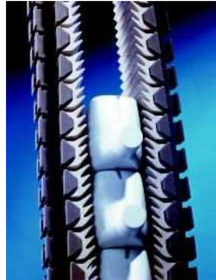
主務チェーン : LF1873GJ Main Chain

TRANSGRIP is designed to grip any type of products. It is equipped with LF1873GJ gripper chains which make elevating or lowering of products possible. The grip width is accurate at any part of conveyor, and it is versatile to various kinds of containers. At speed below 40m/min, aluminium frame standard TRANSGRIP is recommended. At speed over 40m/min, Drum type should be selected. Even at high speed of 80m/min, stable conveying can be obtained.